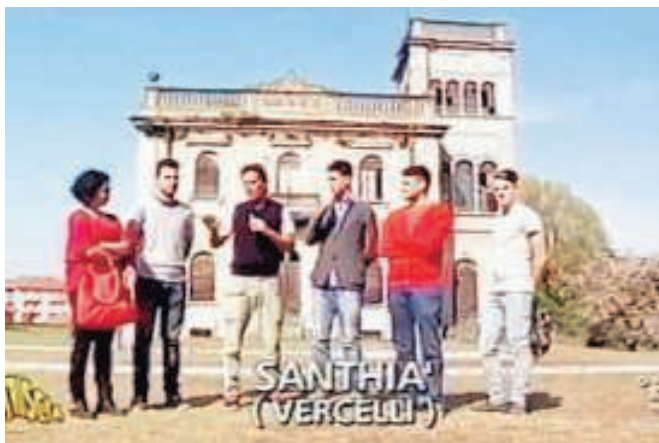
Jimmy Ghione alla Stazione Idrometrica di Santhià

SANTHIA' (rbv) In una sola settimana ben due puntate del programma televisivo «Striscia la Notizia» dedicate a problematiche e virtù della cittadina: quello registrato da Santhià se non si può parlare di record è certamente un picco elevatissimo di attenzione mediatica, giustificata dal fatto che proprio in questo luogo del Vercellese si è registrato un fenomeno in controtendenza. Dopo anni di battaglie dell'amministrazione contro l'installazione di slot machine (nel 2011 se ne contavano ben 110 dislocate vicino al centro cittadino e in luoghi sensibili come scuole e centri di ricreazione giovanile) in città questo genere di apparecchiature sta perdendo terreno. Sono molti i bar e le sale da gioco che hanno deciso di evitare l'installazione delle slot, complice anche la scelta del Comune