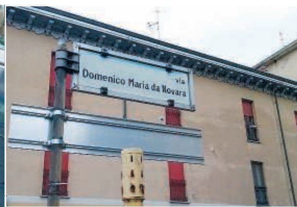
Una delle utilitarie rigate in via Domenico Maria da Novara

NOVARA (bec) Auto danneggiate e atti vandalici in via Domenico Maria da Novara. E' la segnalazione di una delle dipendenti di Gucci: lei come altri hanno trovato sgradevoli sorprese al termine dell'orario lavora-