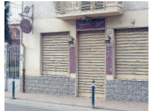
COLPO In questo bar di via Battitore il polacco ha tentato il furto ma è stato subito arrestato dai carabinieri