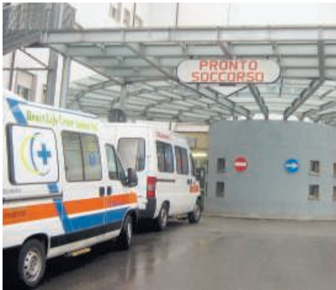
Gli ignoti malviventi avrebbero agito nel cuore della notte

Un furto chiaramente su commissione scoperto solo la mattina di venerdì 14 febbraio dai dipendenti poco dopo dell'inizio dell'orario di lavoro quando, aperti gli appositi frigoriferi dove sono contenuti i medicinali, hanno notato la razzia. Come detto l'area è priva di un antifurto e di telecamere di sorveglianza.