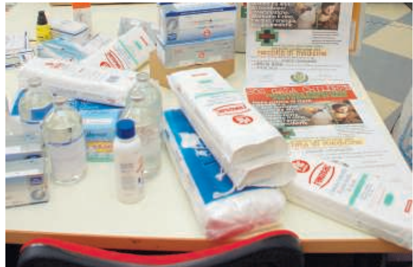
FURTO I ladri sono andati a colpo sicuro dopo aver aperto una finestra. I locali sono privi di sistema d'allarme e telecamere

pressione di conoscere bene i locali da depredare. Ma l'interrogativo è un altro: c'è un mercato verso l'estero o il mercato clandestino è in Italia? Si tratta di canali difficili da intercettare per gli investigatori che, almeno per ora, hanno effettuato solamente piccoli sequestri di medicinali on-line mentre furti, come quello avvenuto in via Battitore, testimoniano la presenza di una organizzazione capace di piazzare la merce rubata senza lasciare tracce, almeno per ora, apparenti.