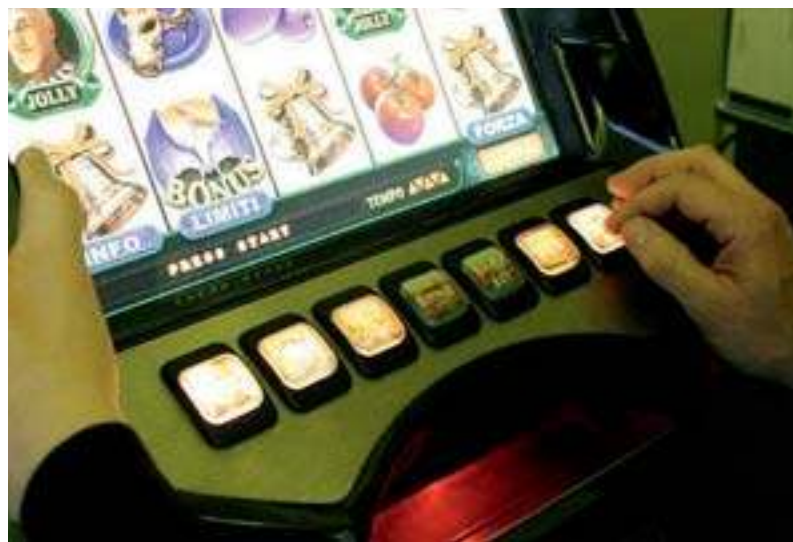
La ludopatia sta diventando una vera piaga sociale

Anche in città la ludopatia è sempre più diffusa. Impegno di politica e scuola