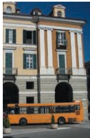
Il trasporto locale sempre più al tracollo è una delle problematiche più seguite dal Consigliere

«In seguito al cataclisma economico degli ultimi anni i miei rimangono, ma spero di smentirmi, dei sogni. Vorrei una città aperta e attenta alle opportunità che gli vengono offerte».