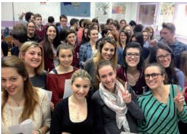
Gli studenti impegnati nella battaglia al gioco d'azzardo

Con i ragazzi del Liceo Balbo flash mob il 3 maggio in piazza Mazzini