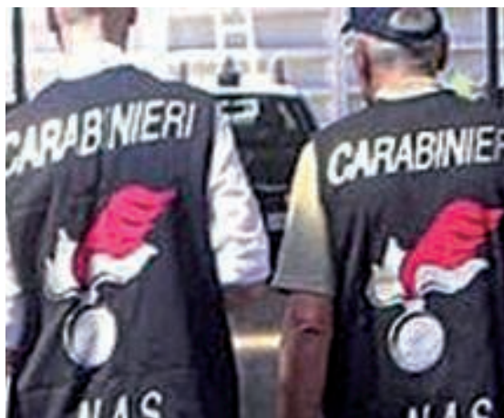
Controlli dei Carabinieri dei Nas a Casale e Villanova

Controllati due esercizi commerciali ed un esercizio pubblico di ristorazione. In un esercizio commerciale di Villanova sanzione di oltre 1000 euro e sequestro di 81 confezioni di materiale vario posto